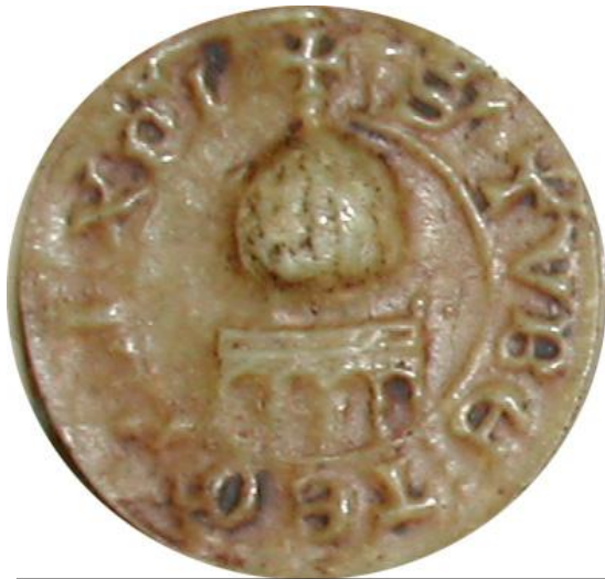
Le « Dôme du rocher » - AN, sc/D 9862 + S' : TVBE : TEMPLI : XPI (Christi)