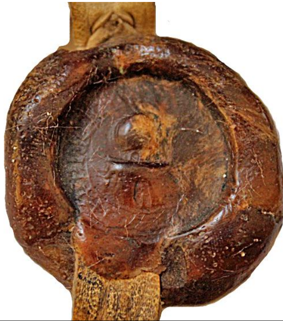
Le « Dôme du rocher » - AN, ??????? + S' : TVBE : TEMPLI : XPI