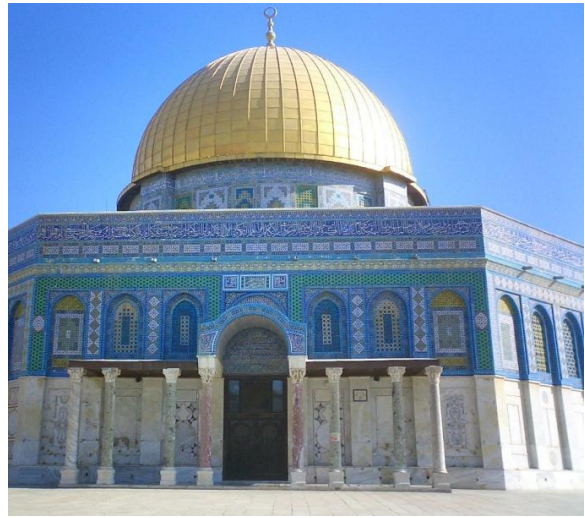
Le « Dôme du rocher ».

Un autre sceau de Maître de l'ordre plus tardif représente avec plus de précision le monument à coupole, ou dôme. Il permet de mieux identifier le monument représenté.