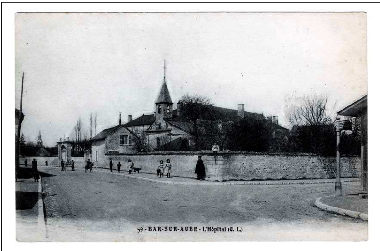
L'hôpital Saint-Nicolas de Bar-sur-Aube. Carte postale du début du XX e siècle.