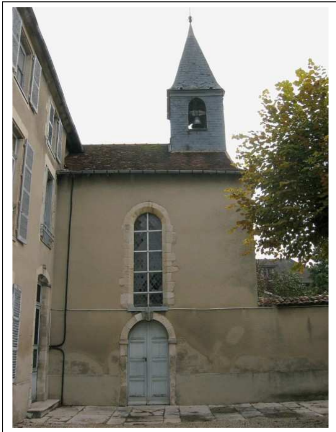
Hôpital Saint-Nicolas de Bar-sur-Aube. La chapelle du XIII e siècle.